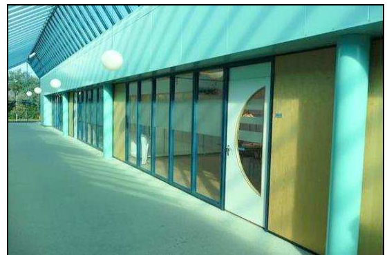
Voorbeeldunit 1 (ca. 55 m 2 ):