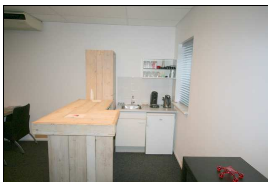
Voorbeeldunit 3 (ca. 75 m 2 ):